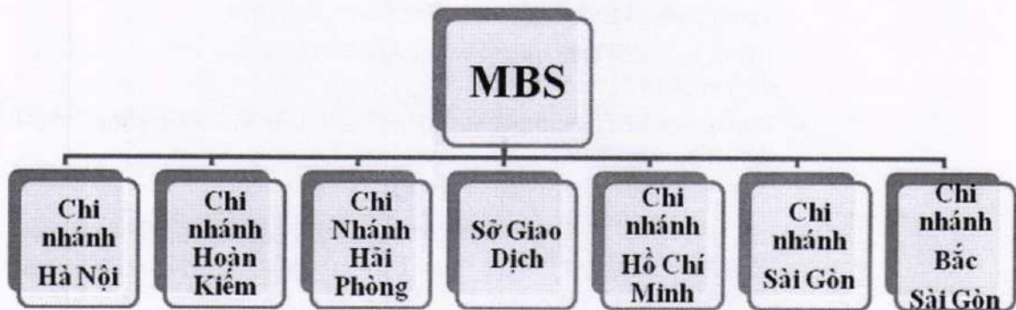
Hình 4: Mạng lưới của công ty.